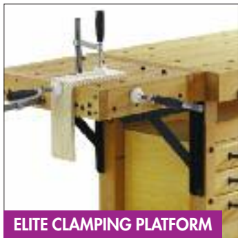
ELITE CLAMPING PLATFORM