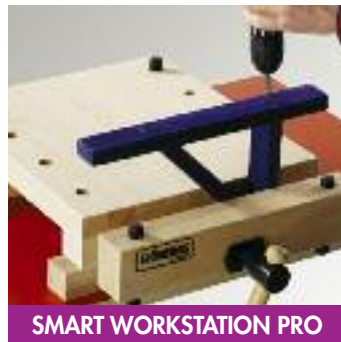
SMART WORKSTATION PRO